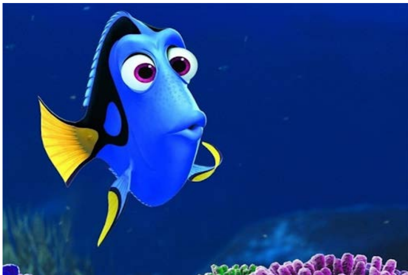
Le Monde de Nemo, Pixar Animation Studios et Walt Disney Pictures, 2003.

Dans cet atelier nous réfléchirons brièvement au fonctionnement de votre cerveau pour pouvoir l'utiliser efficacement, puis nous testerons différentes méthodes d'apprentissage afin de trouver celles qui vous conviennent.