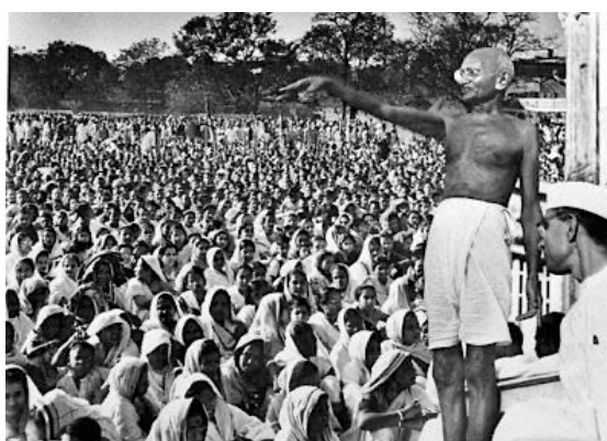
Discours de Gandhi « Quit India », 8 août 1942 à Bombay.

Alors, prêt·e à prendre la parole pour défendre vos idées ?